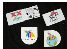
carduri ID, insigne