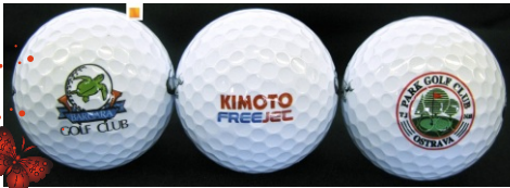
mingi de golf