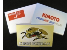
plastic sau metal