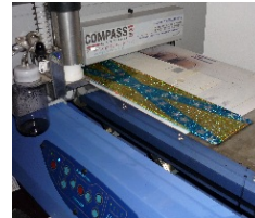
placute de inmatriculare personalizate