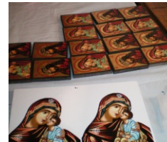
reproduceri opere de arta